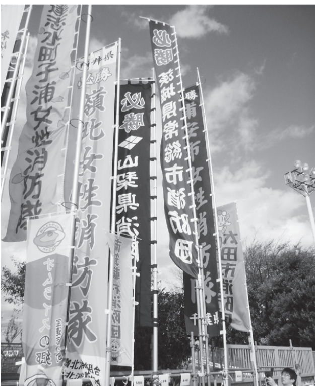
健闘を見守ったノボリ旗

平成二十五年十月十七日、第二十一回全国女性消防操法大会が横浜市消防訓練センターで開催されました。この大会は消防庁と日本消防協会が主催するもので、隔年毎(男子・女子交互)に全国四十七都道府県の女性消防隊が出場して、日頃の訓練の成果を披露し、全国一を競っているもので、本県からは常