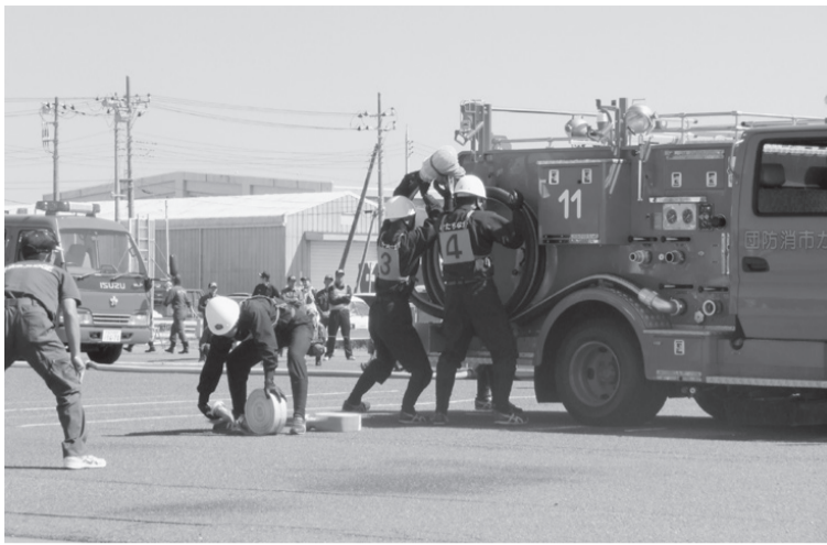
県北地区：操法開始