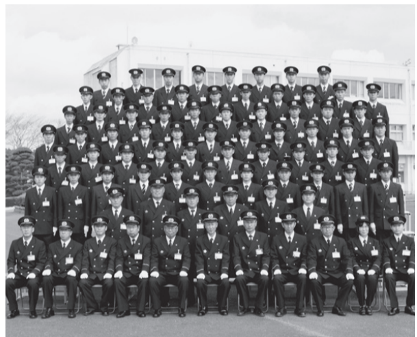
消防学校職員とともに記念撮影