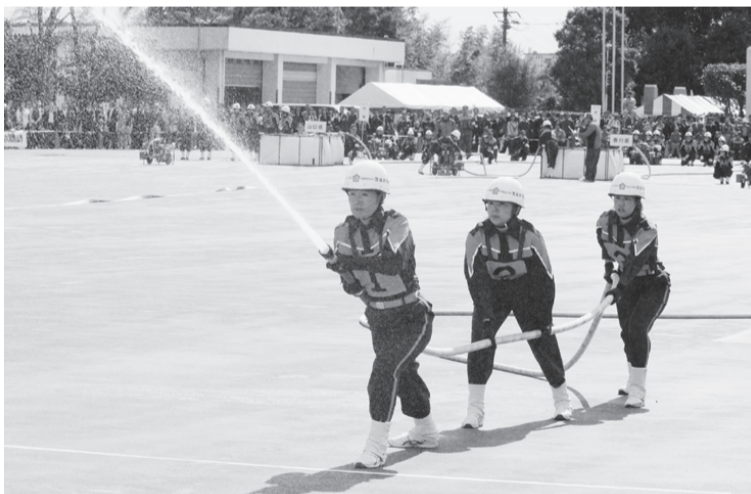
見事な操法を披露