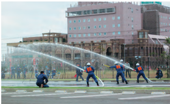
鹿行地区大会の様子