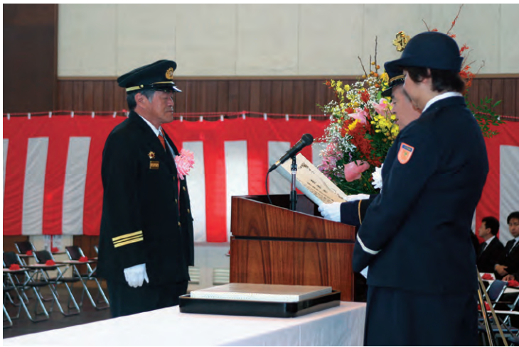
表彰像を授与する表彰