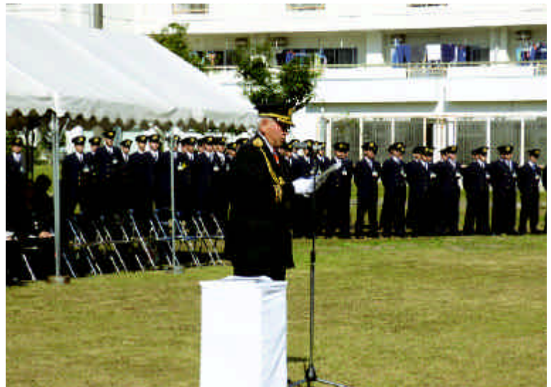
葉梨会長による祭主挨拶