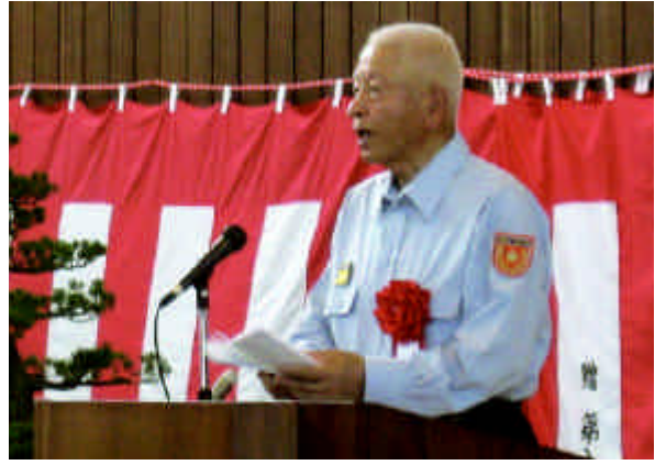
葉梨消防協会会長祝辞