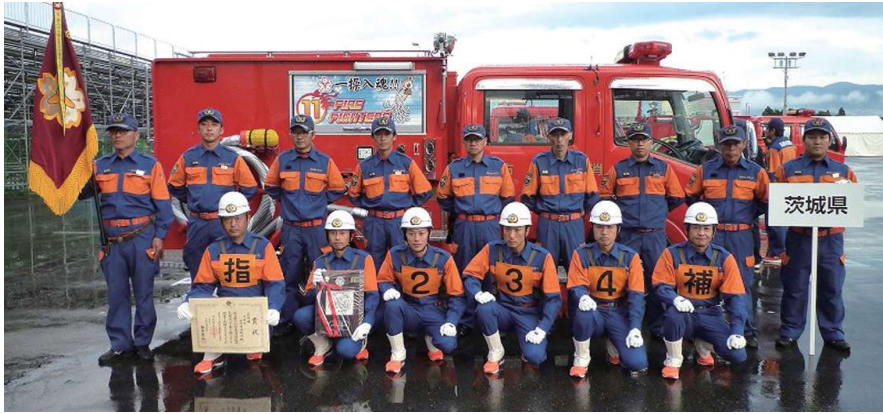
平成30年度 全国消防操法大会

のちに、団員の減少による消防力の低下を補うため、平成二十二年度から機能別消防団員制度、女性消防団を導入したことにより、昼間の火災への消防力が補強され、機能別団員八十一名、女性消防団員十名と団員数を確保することが出来ました。 平成三十年度には、第二十六回全国消防操法大会にて、準優勝を成し遂げ、日頃の訓練成果がいかなく発揮されたとともに、団活動にもさらに勢いがついたところでもあります。