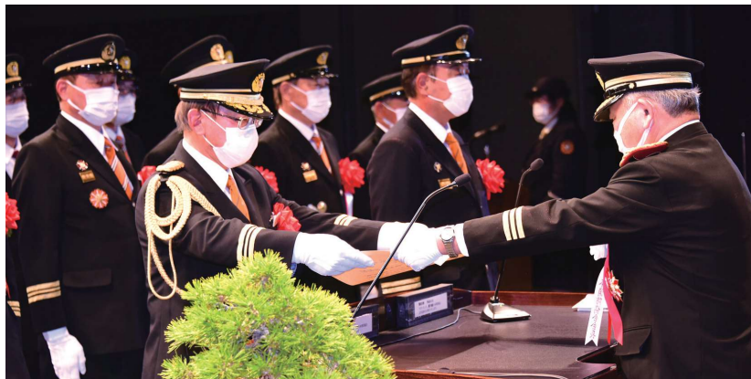
特別表彰「まとい」 古河市消防団