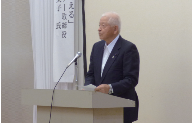
葉梨会長あいさつ

研修では、県消防安全課の館課長から「消防団の充実強化等について」、県立消防学校の本橋校長から「消防団員教育について」各々説明致しました。