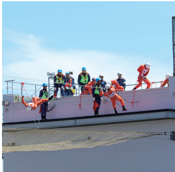
ロープブリッジ救出