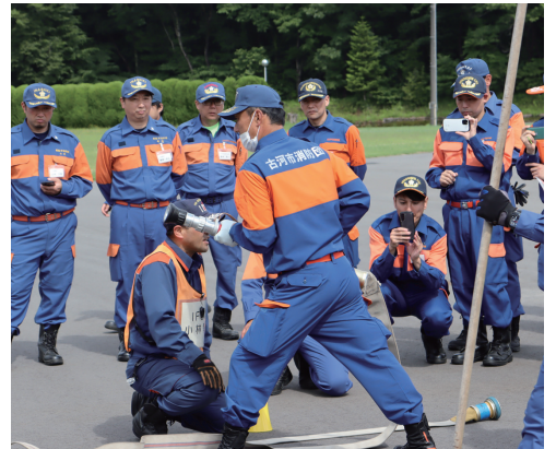
火災防ぎよ(ポンプ操法を基本とした消火訓練)

また、厳しい訓練を通じて協力し合った各消防団員の皆様は、交流の輪が広がったことと思います。 今後、地域に戻られてからも、研修の成果を地元消防団員に対する教育訓練に活用しながら、ご活躍されることをご期待いたします。