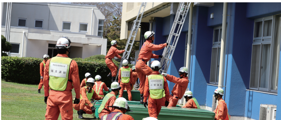
応急はしご救出訓練

本年四月に県立消防学校に入校した新任の消防職員が、約五ヶ月の厳しい訓練を終了して九月七日(木)に卒業し、第一線での活動に従事することになりました。 また、卒業式に先立ち、九月一日(金)には、これまでの教育訓練の集大成として総合展示訓練が行われました。 各消防本部の消防長などが見守るなか、卒業生八十九名が一丸となり・救急活動訓練・三連はしご取扱訓練・応急はしご救出訓練など、これまでの厳しい訓練の成果を見事に披露するとともに、消防士として成長したたくましい姿を見せてくれました。