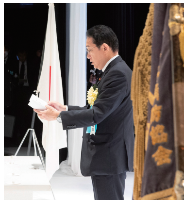
岸田総理による追悼の言葉