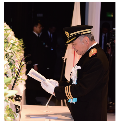
秋本会長による式辞