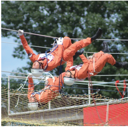
ロープブリッジ救出