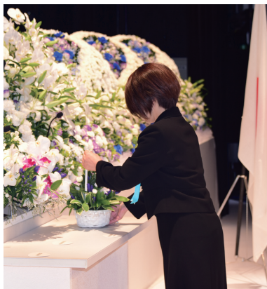
新たに合祀されたご遺族代表献花

なお、本年は三柱の御霊が新たに合祀され、明治五年からの消防殉職者等の御霊は、五千七百八十七柱となりました。