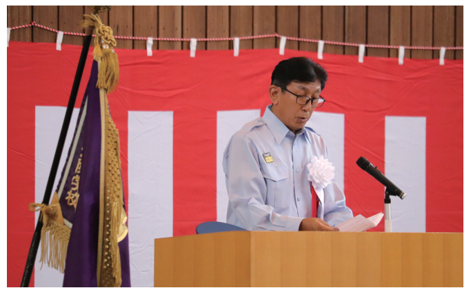
知事告示 (館消防安全課長)