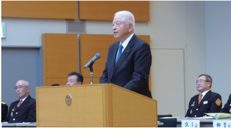
葉梨会長あいさつ

各市町村消防団長や女性消防団員など、多数のご参加をいただき、予定した約三百席は満席となりました。