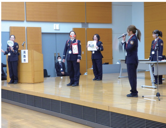
筑西市消防団の発表