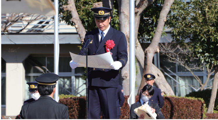
大井川知事賞状授与

新春を飾る消防出初式が、一月六日(土)・七日(日)・八日(祝)・十三日(土)・十四日(日)の五日間で、県内四十市町村において、開催されました。(※ほかの四市町は、二月から三月にかけて、春季点検式として開催される予定。)