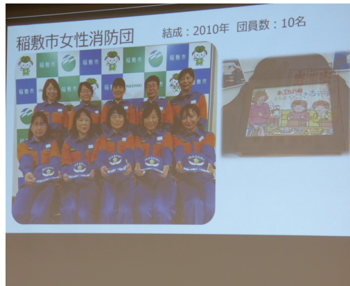
稲敷市消防団の発表