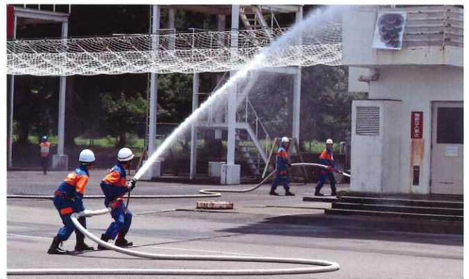
建物火災を想定した実技訓練

消防団員の教育訓練の中心を担う、幹部課程ということで、「幹部の心得」をはじめ、「安全管理」、「訓練礼式」、「災害情報収集・伝達」、「火災防ぎよ」等の座学、「救助・救命活動」や建物火災を想定した実技訓練など、災害現場での対応だけでなく、幅広い研修を実施することにより、幹部団員としての知識や技術の研鑽を図りました。