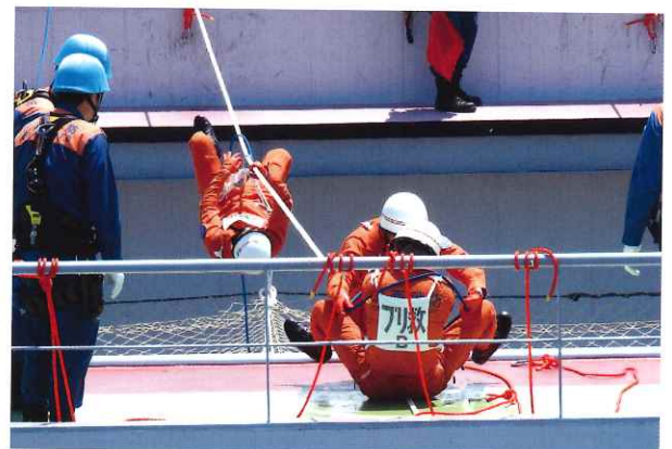
ロープブリッジ救出