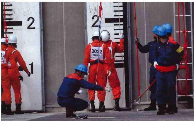
ロープ応用登はん