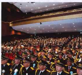
ニッショーホール会場の様子