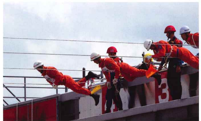
ロープブリッジ渡過