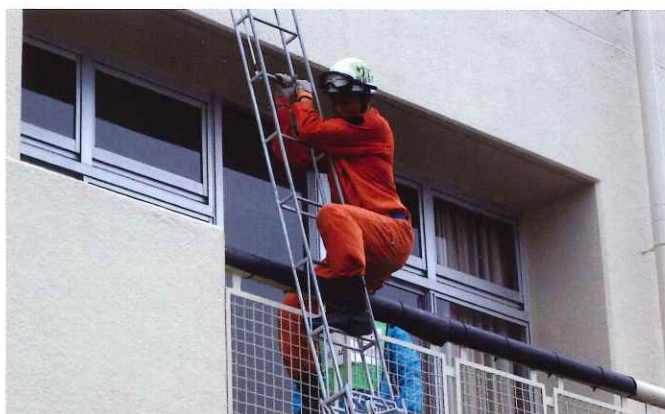
応急はしご救出訓練

本年四月に県立消防学校に入校した新任の消防職員が、約五ヶ月の厳しい訓練を終了して九月五日(木)に卒業し、第一線での活動に従事することになりました。 また、卒業式に先立ち、八月三十日(金)には、これまでの教育訓練の集大成として総合展示訓練が行われました。各消防本部の消防長などが見守るなか、百名が一丸となり・救急活動訓練・三連はしご取扱訓練・応急はしご救出訓練など、これまでの厳しい訓練の成果を見事に披露するとともに、消防士として成長したたくましい姿を見せてくれました。